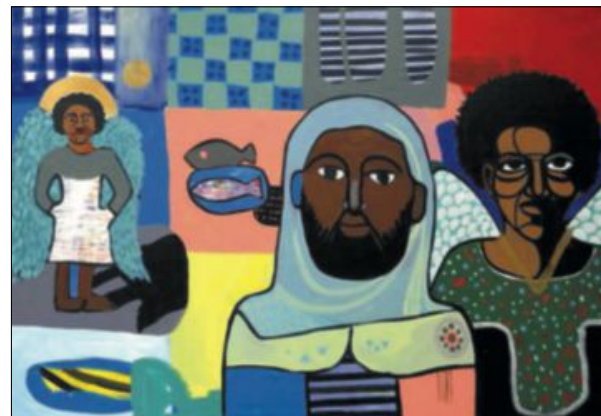
PERSONER: Fadlabi maler mennesker, superhelter og helgener.