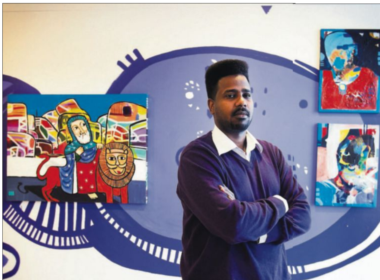
POLITISK KUNST: Fram til 13. april dekker Fadlabis «The Prediction Machine» veggene på Kunstplass 5, et visningssted med fokus på politisk kunst.

lykkes i krysse grensene fysisk. «The Prediction Machine» er invitert til å stilles ut på den prestisjetunge Sharjah Biennial II i De forente arabiske emirater, en av de største kunstbegivenhetene i den arabiske verden. Fadlabi har tidligere stilt ut verker på utstillinger i både Tyskland, Frankrike, Sverige og Sudan. ragnhild.njie@dagsavisen.no